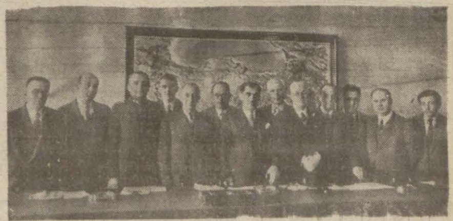
Coğrafya Cemiyetinin Ankara'da Maarif Vekili Hasan Âli Yücelin başkanlığında ilk toplantısını yaptığını yazmıştık. Resmî Vekili bu toplantıda bulunmalarıyla bir arada gösteriyor.