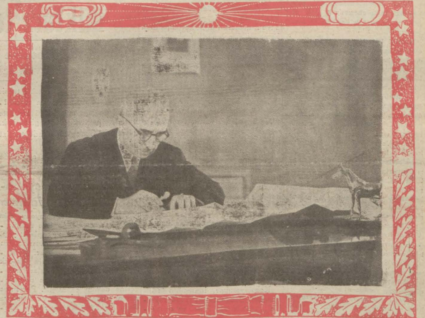
Millî Şefimizin son resimlerinden biri